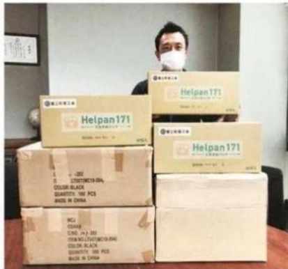
蟹江町商工会が熊本県の芦北町商工会に届けた備蓄用パン入りの箱＝蟹江町で

蟹江町商工会は十五日、甚大な豪雨被害に遭った熊本県の芦北町商工会に支援物資として災害備蓄用のパン四百食分を届けた。備蓄